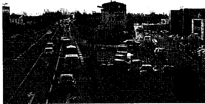
Blick von der Brücke A 66 nach Süden auf den Knoten