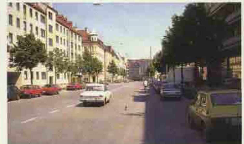
Straßenbegrünung – ganz privat: an Hauswand oder Balkon. Im Vorgarten oder auf dem Bürgersteig.