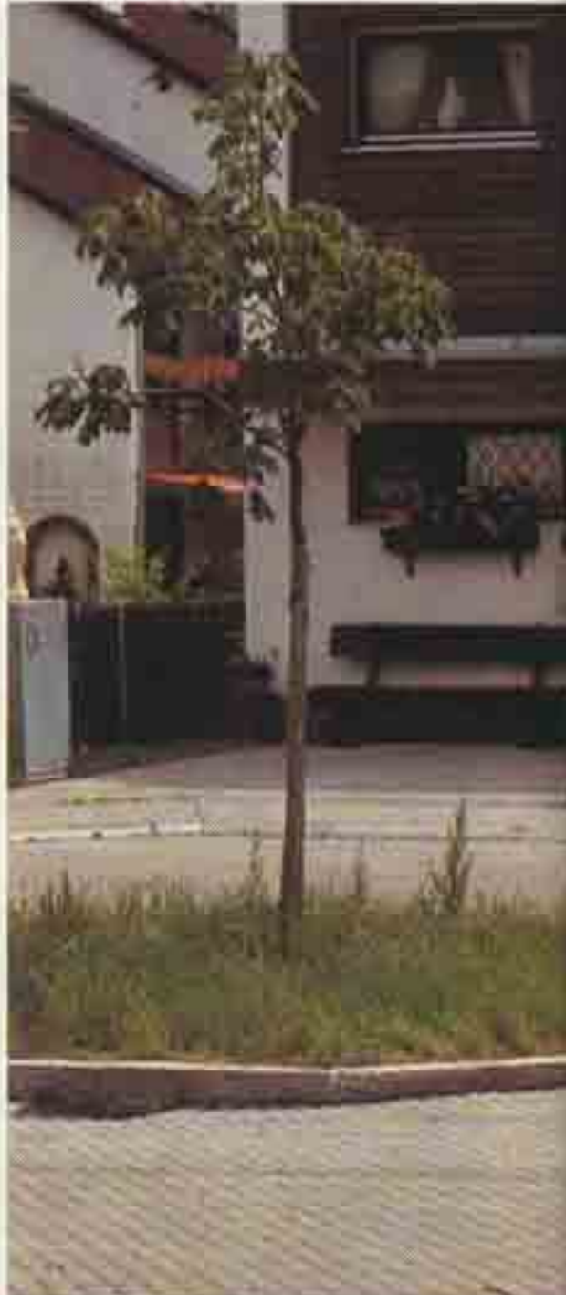
Wenn sie alt sind, machen sie selbst Tankstellenreklamen, Peitschenmasten und Signalanlagen erträglich.