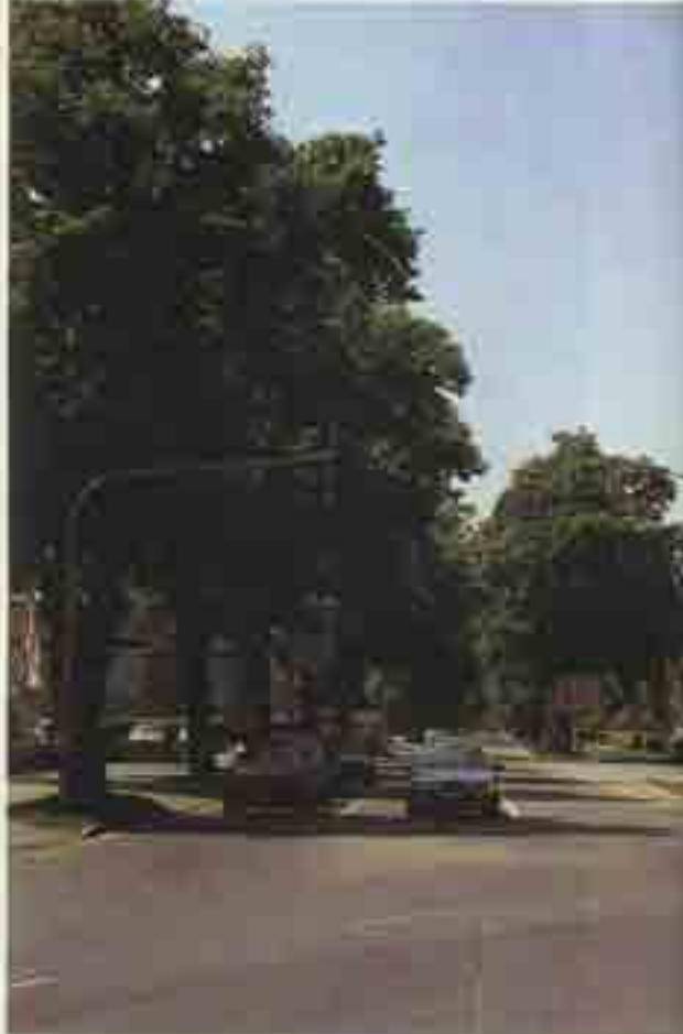
Wenn sie alt sind, machen sie selbst Tankstellenreklamen, Peitschenmasten und Signalanlagen erträglich.